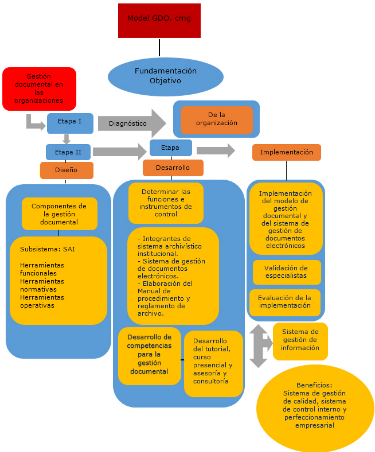
Fig. 2. Modelo de gestión documental.