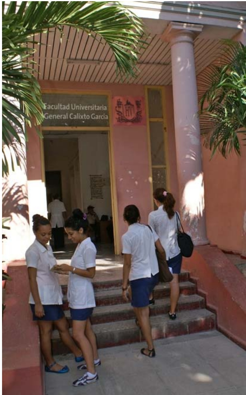
Fig. 1. Actual edificio de la Facultad de Ciencias Médicas "Calixto García Íñiguez".