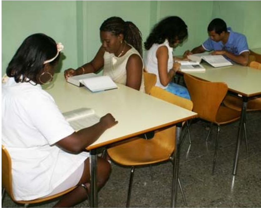
Fig. 3. Sala de lectura de la biblioteca de la Facultad "Calixto García".