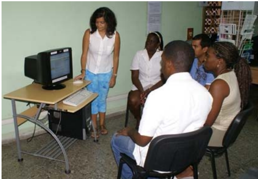
Fig. 5. Educación a usuarios y bibliotecarios de la Facultad por parte de especialista de la Biblioteca Médica Nacional.