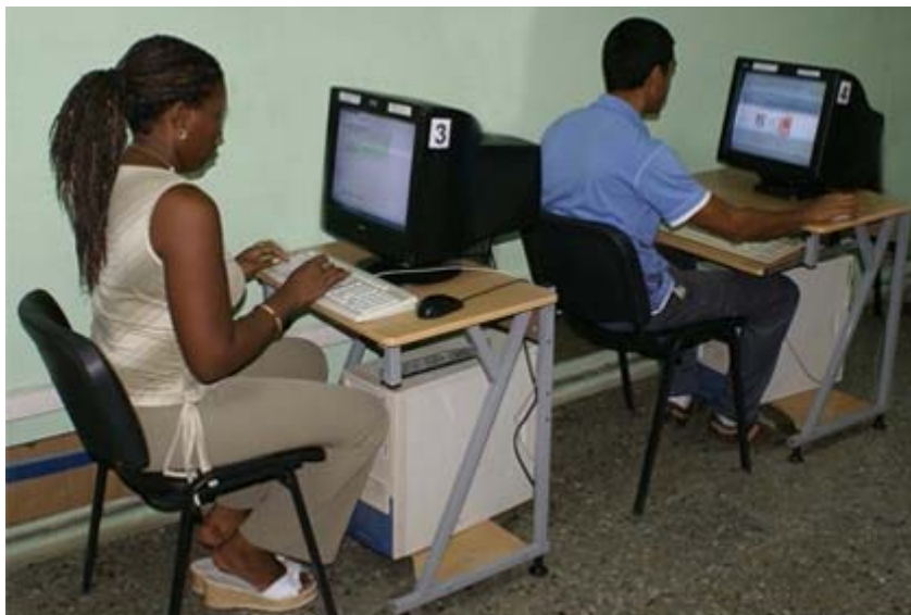
Fig. 4. Sala de navegación de la biblioteca de la Facultad "Calixto García".