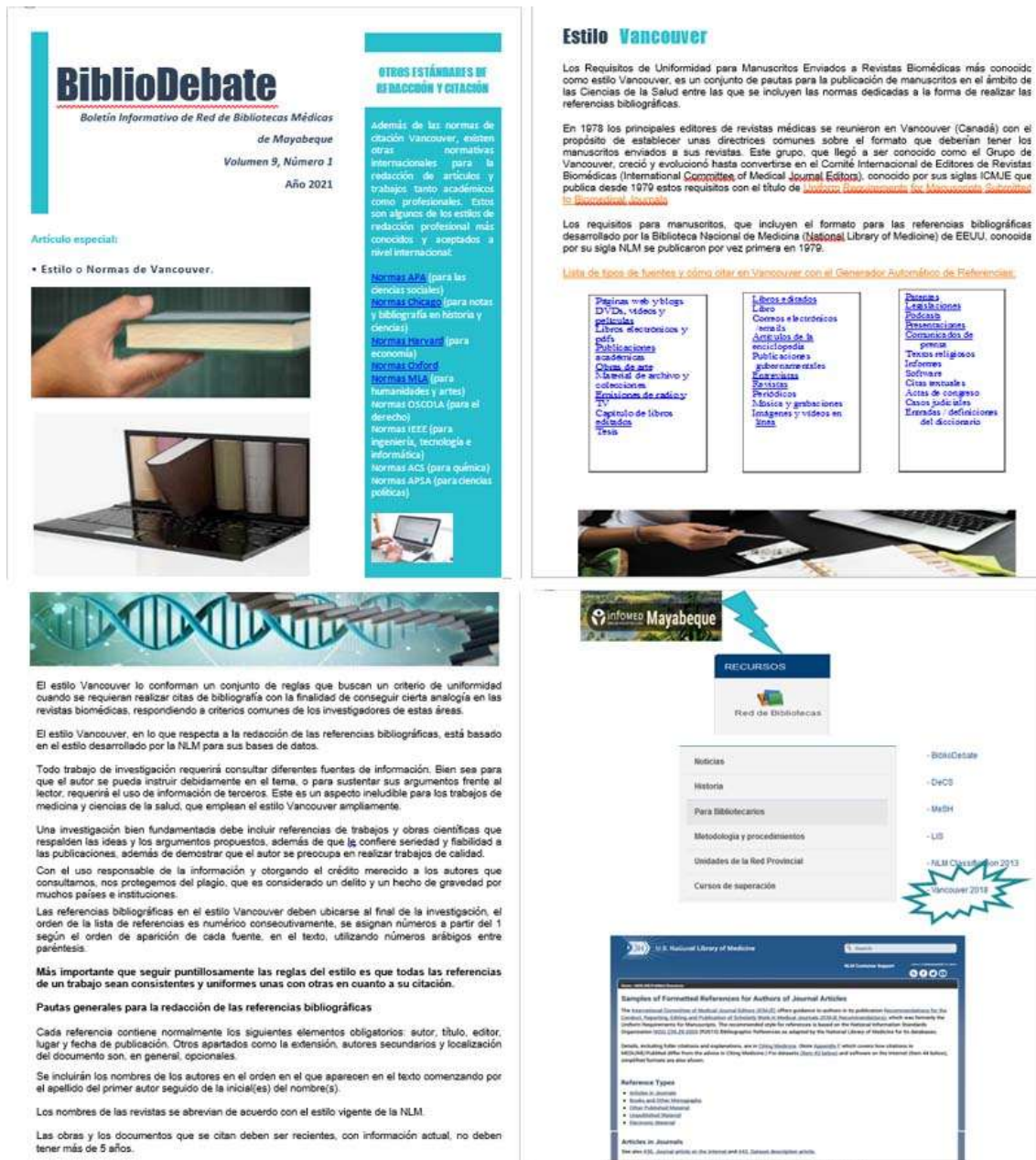
Fig 1 - Boletín Bibliodebate.

Este boletín se elabora en formato PDF y consta de 3 secciones: