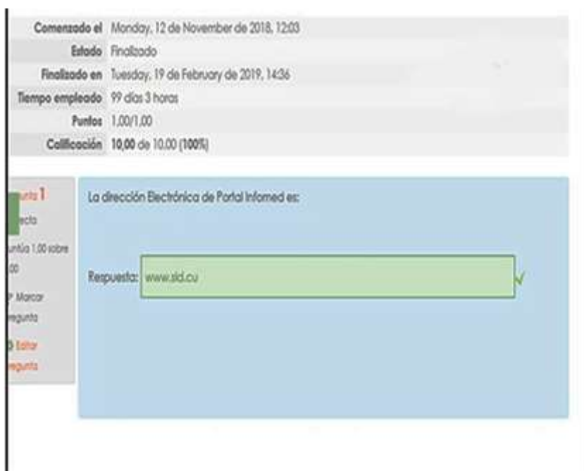
Fig. 5 - Respuestas cortas emparejadas.