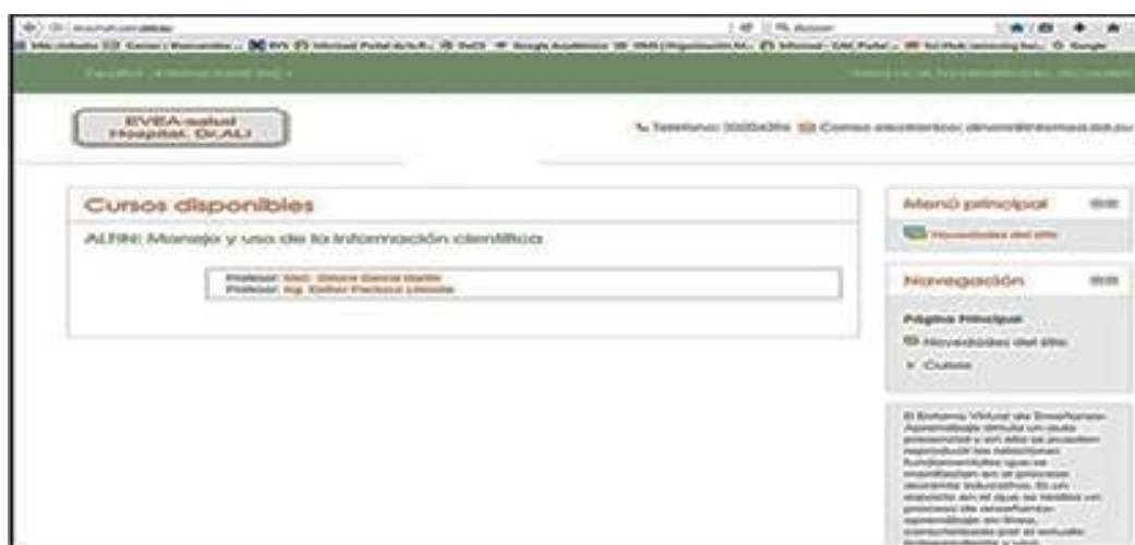
Fig. 1 - Página principal.

Se instaló una plataforma Moodle como soporte del Aula Virtual, GNU Public License, que se distribuye gratuitamente como Software libre, versión del Moodle 2016052301, revisión del Moodle 3.1.1 (Build: 20160711), © 1999, en idioma español, con algunas adecuaciones por las características propias del Moodle en que se soporta (Fig.1).