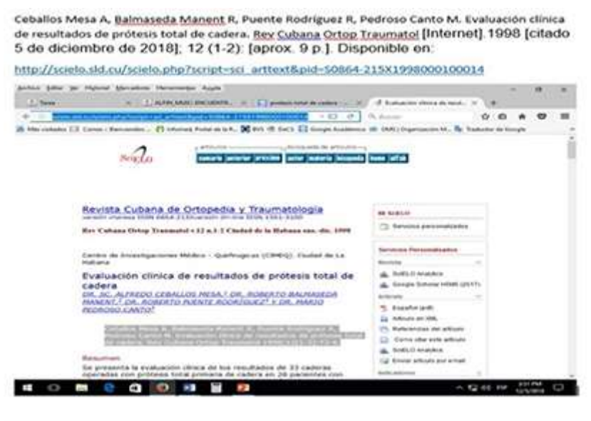
Fig. 6 - Tarea o actividad de aprendizaje.

Esta última forma de evaluación está diseñada en el EVEA para que el participante suba la respuesta en archivos de hasta 1 MB. En este tipo de pregunta los participantes adquieren habilidades de búsqueda de información y de informática, porque al efectuar el ejercicio indicado, deberán realizar la captura de la imagen de todo el proceso de búsqueda, pegarlo en una hoja Word