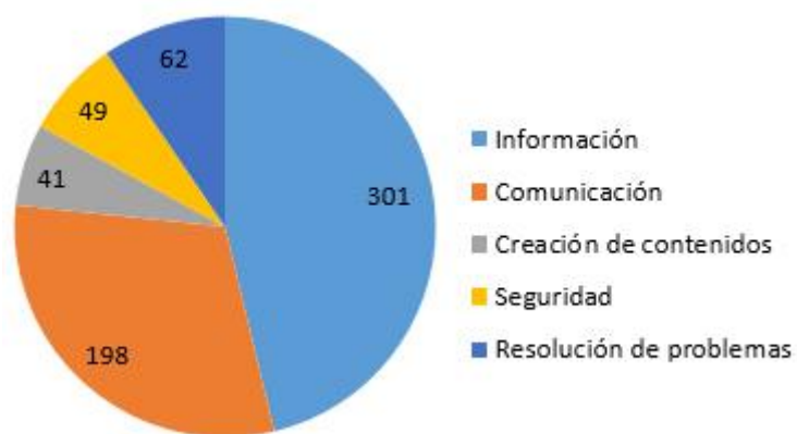
Fig. 4 - Resumen de las consultas planteadas en tutorías.