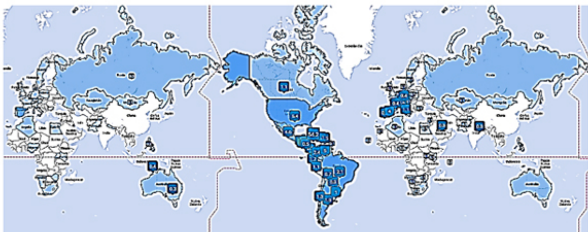
Fig. 4. Distribución de seguidores de @InfomedCuba en Twitter.

Desde el 21 de abril de 2014, fecha en que se publicó el primer tweet en la cuenta de Infomed en Twitter, hasta el 30 de abril de 2018, los principales resultados son: Seguidores: 1 814, Favoritos: 1 355, Cantidad de Tweets: 12 052. Estos indicadores también han ido mejorando con el transcurso del tiempo (Fig. 2). En el último mes incluido en el presente estudio, los tweets alcanzaron aproximadamente 71 500 impresiones y el perfil obtuvo 983 visitas. De acuerdo con Twitonomy, 48 de cada 100 mensajes publicados fueron redistribuidos, lo que indica un nivel de repercusión alto. El análisis realizado con Tweepsmat mostró que la mayor parte de la audiencia se concentra en Cuba y demás países de Las Américas, Estados Unidos, Reino Unido y España (Fig. 4).