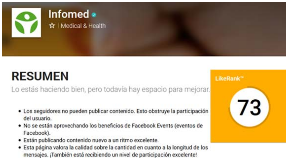
Fig. 3. Resultados del análisis de LikeAlyzer sobre la página de Infomed en Facebook. Abril 2018.

Desde el 21 de abril de 2014, fecha en que se publicó el primer tweet en la cuenta de Infomed en Twitter, hasta el 30 de abril de 2018, los principales resultados son: Seguidores: 1 814, Favoritos: 1 355, Cantidad de Tweets: 12 052. Estos indicadores también han ido mejorando con el transcurso del tiempo (Fig. 2). En el último mes incluido en el presente estudio, los tweets alcanzaron aproximadamente 71 500 impresiones y el perfil obtuvo 983 visitas. De acuerdo con Twitonomy, 48 de cada 100 mensajes publicados fueron redistribuidos, lo que indica un nivel de repercusión alto. El análisis realizado con Tweepsmat mostró que la mayor parte de la audiencia se concentra en Cuba y demás países de Las Américas, Estados Unidos, Reino Unido y España (Fig. 4).